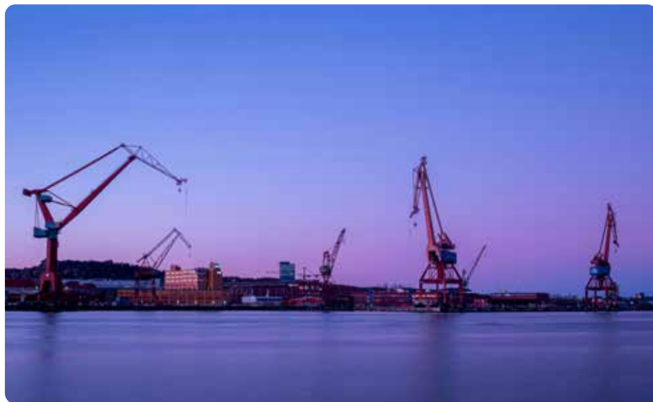
Med Vänsterpartiet vid förhandlingsbordet har Göteborg slutat sälja ut allmännyttan. Istället byggs nya lägenheter.